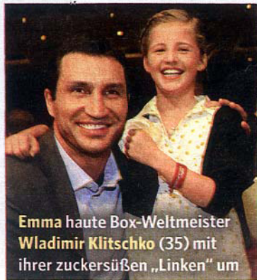
Emma haute Box-Weltmeister Wladimir Klitschko (35) mit ihrer zuckersüßen „Linken“ um